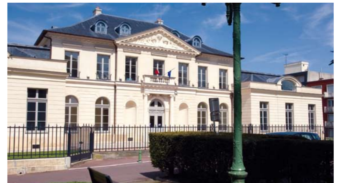
Le château seigneurial