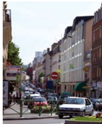
L'animation du centre-ville