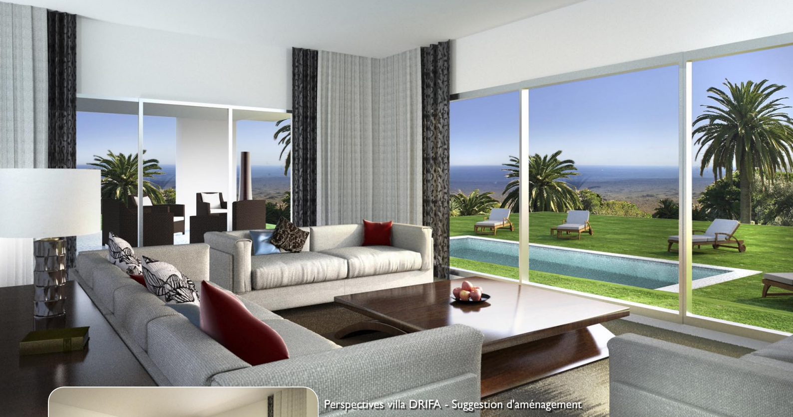
Perspectives villa DRIFA - Suggestion d'aménagement