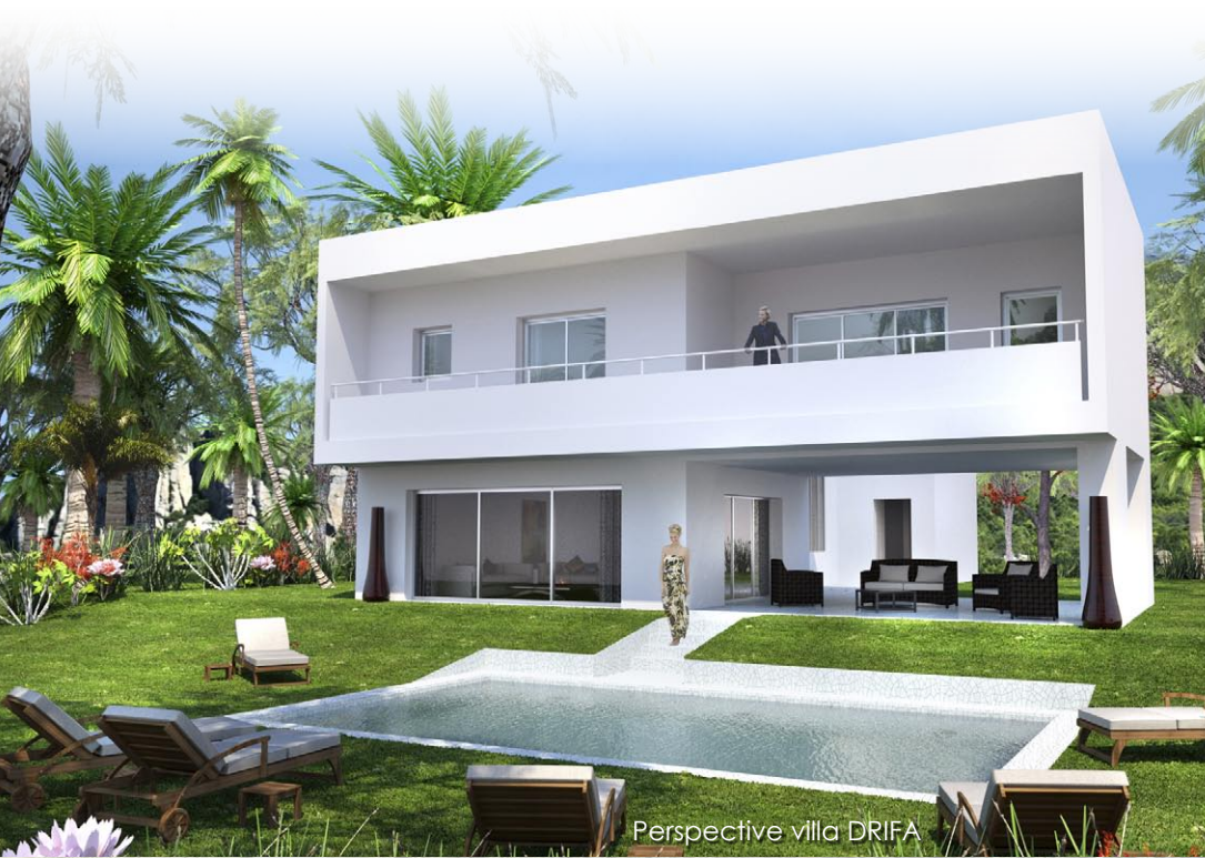
Perspective villa DRIFA